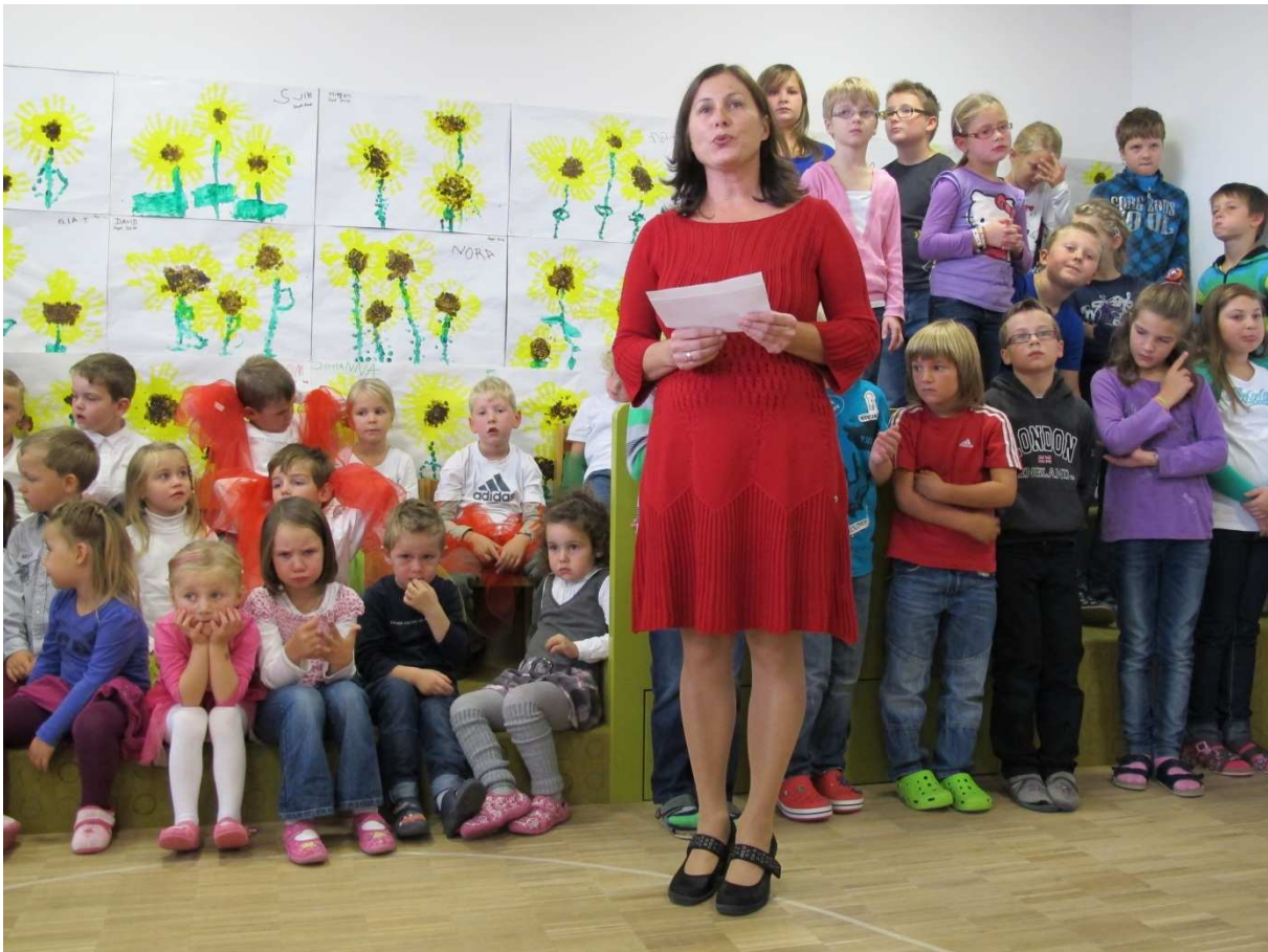
Gabys Worte an die Festgemeinde ...