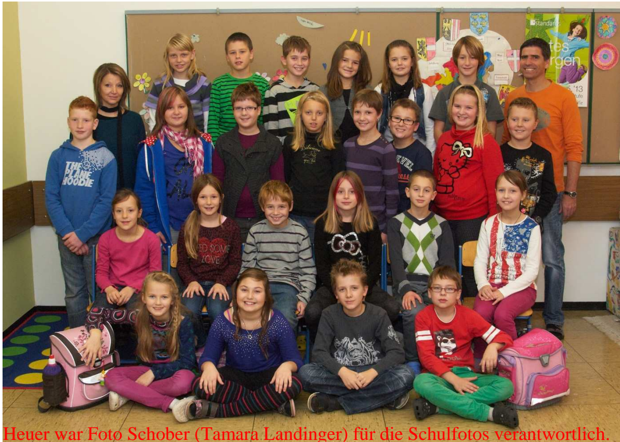
Heuer war Foto Schober (Tamara Landinger) für die Schulfotos verantwortlich.